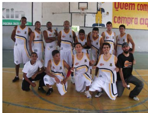
LBCA na Supercopa Nordeste de Basquete.