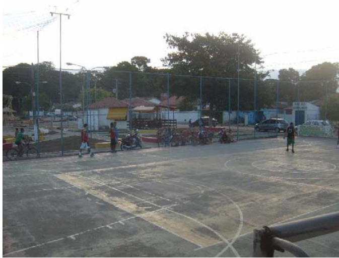
Quadra da Rua da Mata em 2010, degradada e precisando de reforma.

Abaixo, algumas fotos das ações da LBCA na quadra da Rua da Mata: