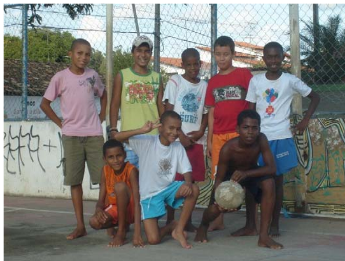
Crianças que brincam na quadra da Rua da Mata.

A quadra da Rua da Mata é muito utilizada pela comunidade, basicamente para prática do futsal e do basquete, além de servir de ponto de encontro para as crianças brincarem.