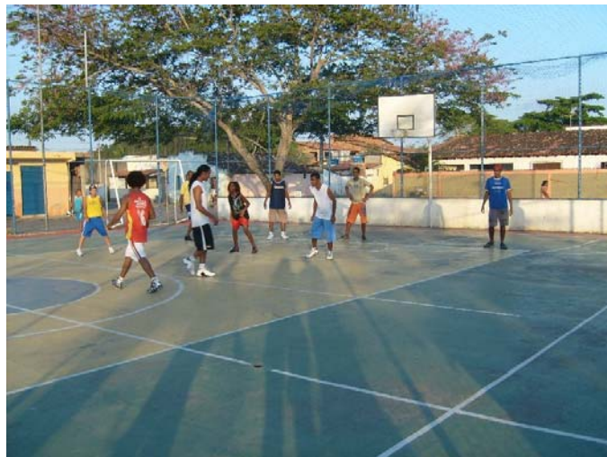
Quadra da Rua da Mata em 2007.

A quadra da Rua da Mata foi reformada em 2006, mas, desde então, nunca teve manutenção referente aos equipamentos esportivos (traves, girafa, tabela, aros, pintura). Sempre é necessário angariar recursos junto à comunidade para consertar os equipamentos quebrados.