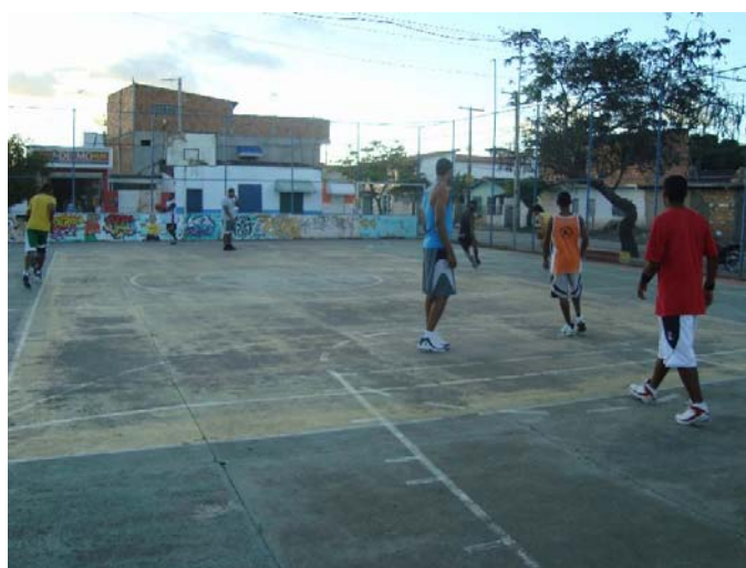
Quadra da Rua da Mata em 2009.

A LBCA sempre tem antecipado as ações e feito sua parte. Com cerca de 40 membros, efetuamos várias ações na quadra, consertando os aros, as tabelas e as girafas.