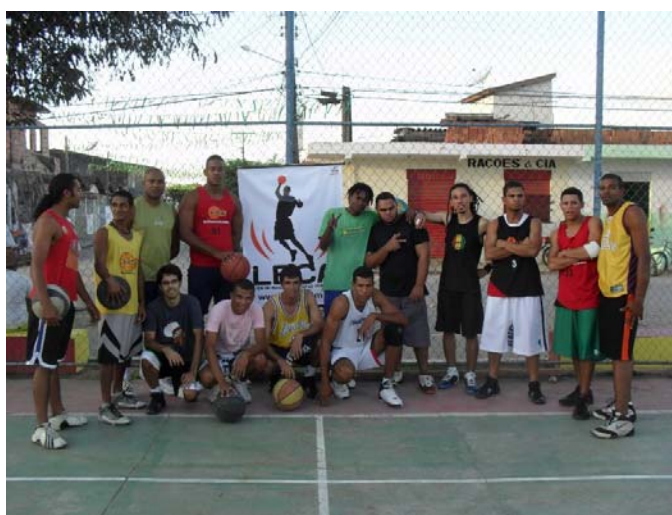
Alguns membros da LBCA reunidos.

A LBCA tem um site em que todas as ações são divulgadas: www.lbca.com.br . O site conta com cerca de 1000 acessos mensais.