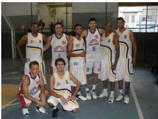
LBCA na Copa Feirense de Basquete.