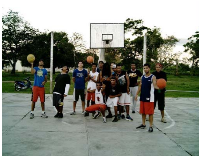
Prática de basquete na antiga Escola de Agronomia, hoje UFRB.

Em 2006, após a reforma da Praça da Rua da Mata, os praticantes adotaram a quadra e passaram a se encontrar aos sábados.